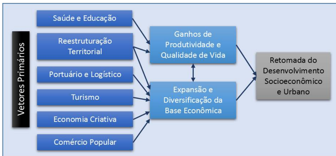
Quadro 1 - Dimensões da Retomada do Desenvolvimento e suas Interrelações

Para se ter um PIB per capita crescente, a produtividade do trabalho é variável determinante, o que, dado o quadro antes traçado, envolve investimentos em Saúde e Educação. Mas isso não basta, é preciso também reduzir o desemprego, criando novas frentes de trabalho. Para tanto, conforme se explicita no Quadro 1, é indispensável reconstruir a base econômica da cidade, empreendendo um amplo desenvolvimento socioespacial dos bairros populares em geral, resgatando antigos setores como o portuário/logístico, dinamizando setores como o turismo, bem como criando novas frentes de expansão econômica em áreas como a alta tecnologia e economia criativa.